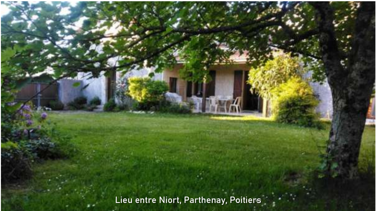
Lieu entre Niort, Parthenay, Poitiers

La Grange Madame 8, rue de la Sayette 79 340 Vasles ☎ 05.49.69.94.64